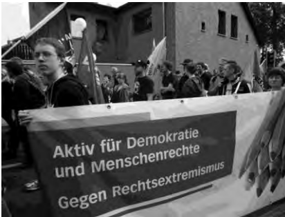
Demo für eine Bunte Schorfheide